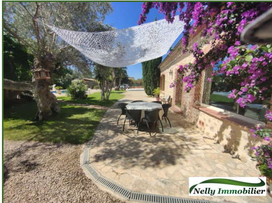
Coup de cœur

Référence 2142 Idéalement située dans un havre de paix, proche de Perpignan, cette propriété d'environ 300 m 2 habitable, implantée sur 5080 m 2 de terrain offre des espaces de vie baignés de soleil.